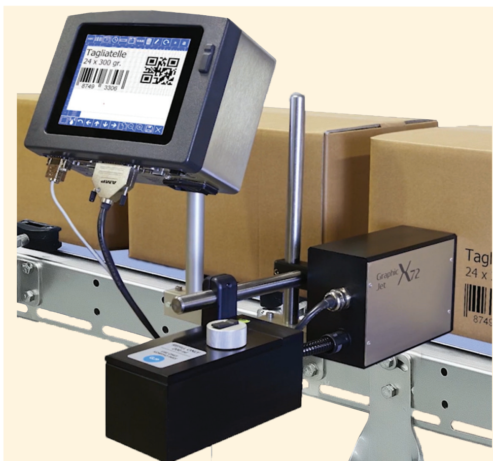
X72 - Marquage (2 têtes) sur les deux côtés du convoyeur