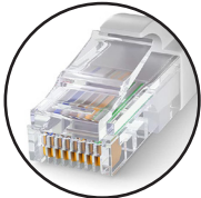
Impression messages alphanumériques / Logos / Codes à barres / Variables automatiques