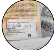
Marquage sur différentes matières (film plastique ou papier)