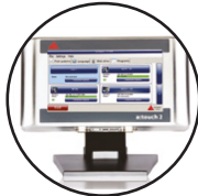
Écran couleur tactile inox