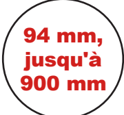
Diamètre de rubans (Autonomie de la cassette porte-ruban)