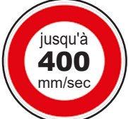
Vitesse d'impression en mode intermittent