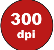
Haute qualité d'impression